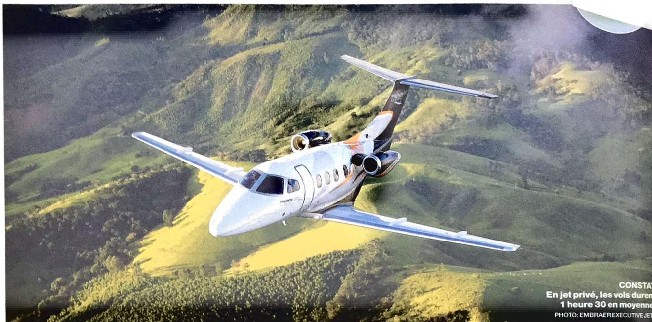
CONSTAT En jet privé, les vols durent 1 heure 30 en moyenne.

Après avoir subi les effets de la crise de 2008 , le secteur se reprend progressivement avec de nouvelles perspectives de marché. Désormais, il existe des jets privés plus petits et plus économiques. On les appelle parfois les taxis des airs. Le milieu des jets privés véhicule son lot de fantasmes et de glamour. Les stars et riches entrepreneurs constituent toujours une grande partie de la clientèle. Si les avions privés restent luxueux, leur location est devenue moins chère.